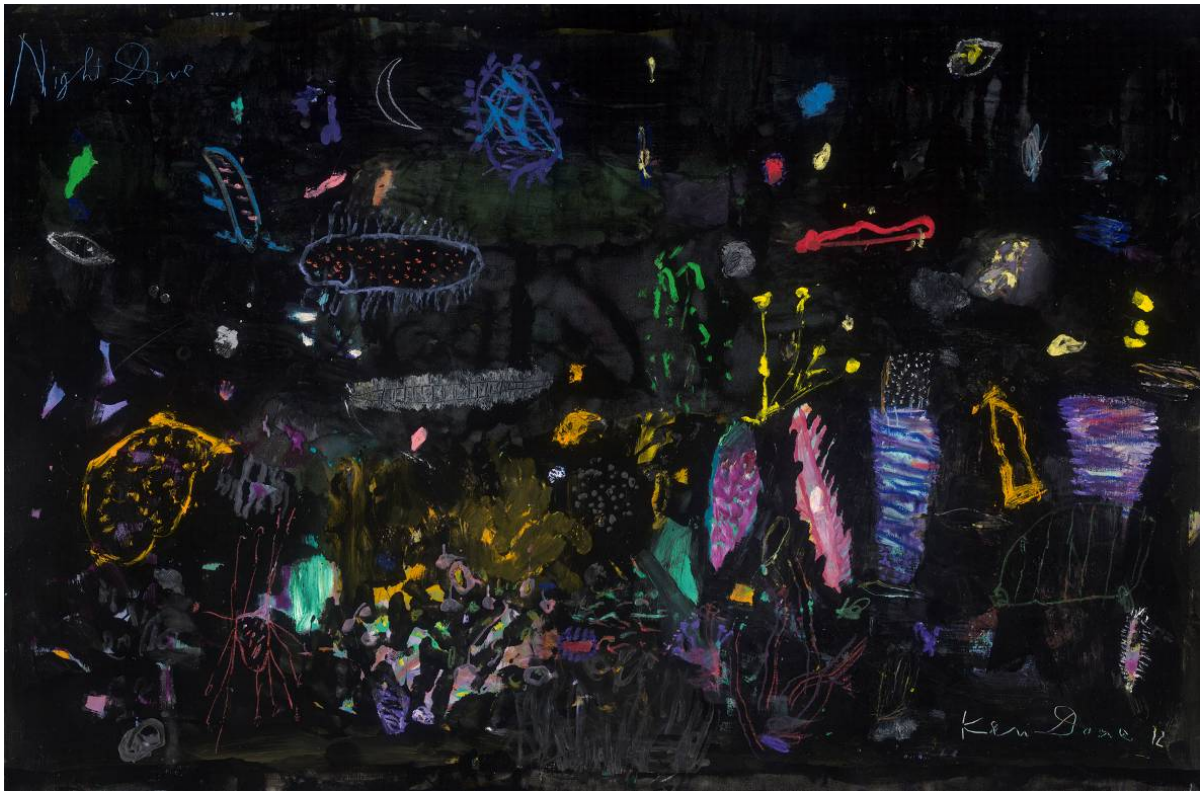
night dive 1,120x181cm, 2012