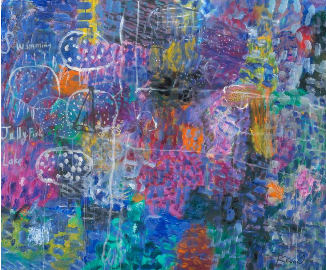
swimming in jellyfish lake, 152.5x183m, 2013