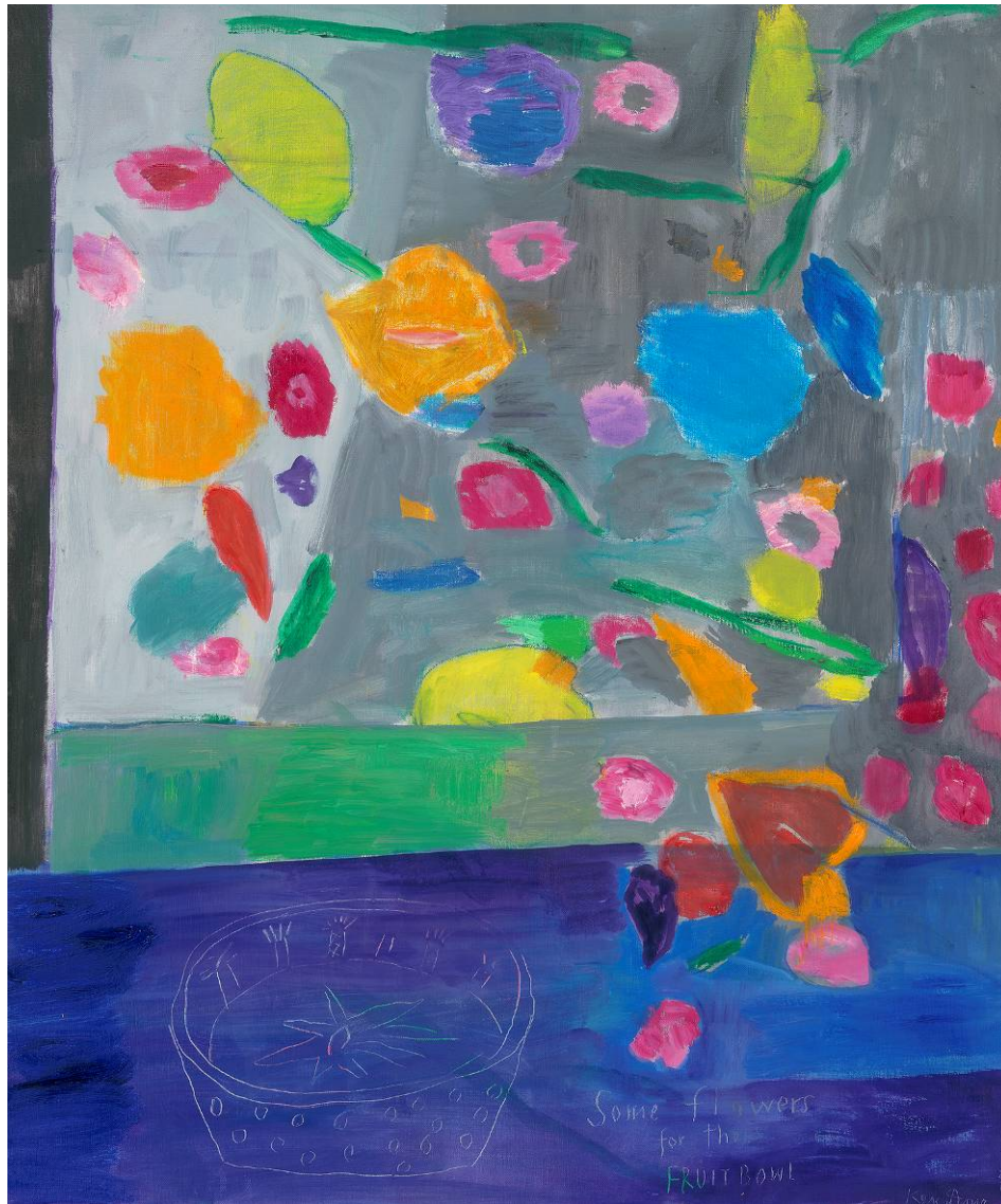
some flowers for the fruit bowl, 122x102cm, 20131993