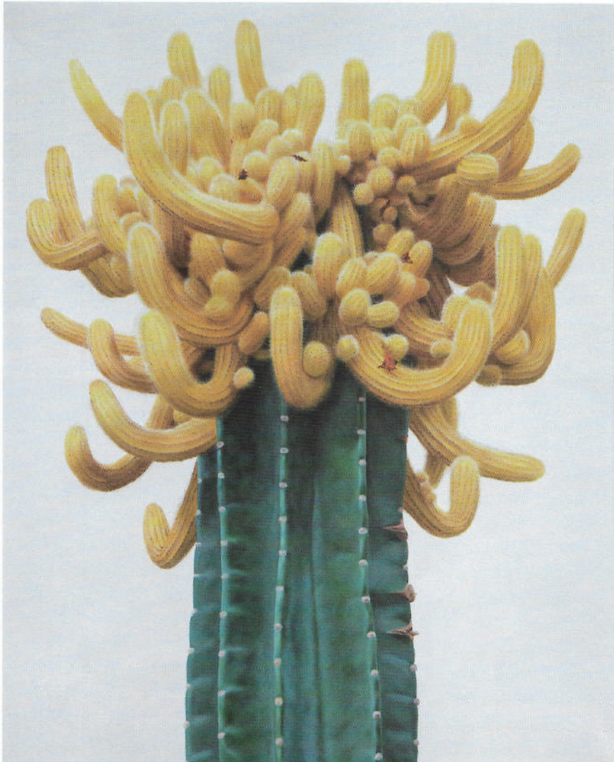
Cactus No.69 Oil on Canvas, 162.1×130.3cm / 2011

이광호 작가는 <Inter-View>, <선인장> 연작으로 대상의 사실적 재현에 기반을 두지 않고 주관적 해석과의 간극을 다양한 소재를 활용해 표현해 왔다. 뚜렷한 피사체의 형태가 드러나는 인물과 정물을 2차원 캔버스에 오롯이, 그 대상만 집중할 수 있게 그려냈다면 풍경은 특정한 사물인 구획이 존재하지 않는다.