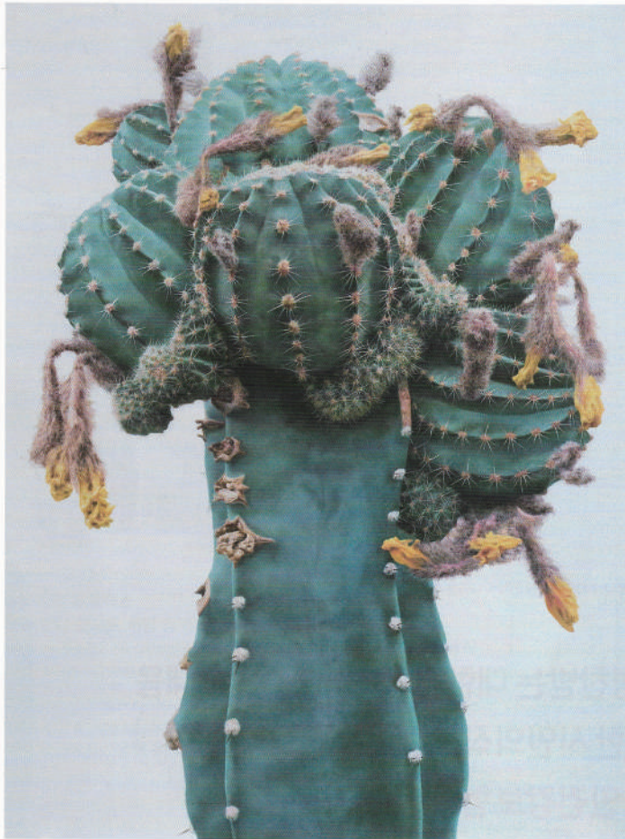
Cactus No.93 Oil on Canvas, 259.1x193.9cm / 2015